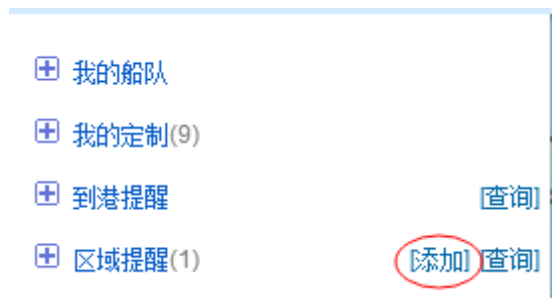
图 4 区域提醒-添加