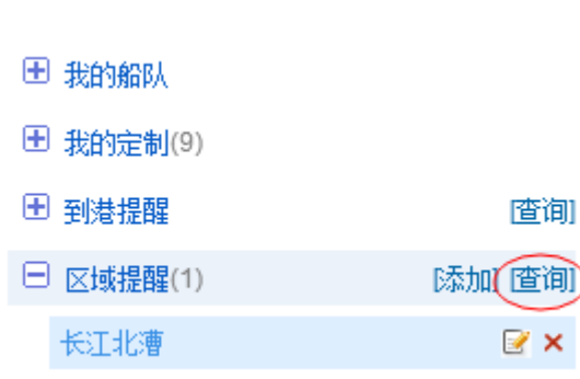
图 7 区域提醒-查询