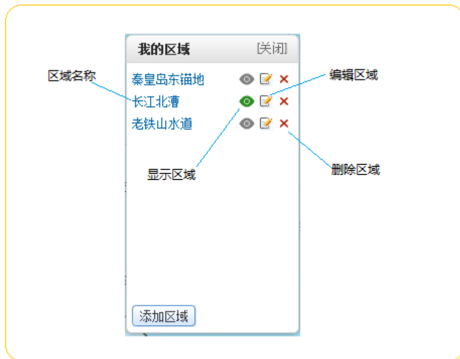
图 3 我的区域